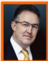
Burgemeester A. Aboutaleb, Voorzitter Coördinerend bestuurder

Zes leden uit het Algemeen Bestuur vormen het Dagelijks Bestuur. Het Dagelijks Bestuur is belast met de voorbereiding en uitvoering van de besluiten die het Algemeen Bestuur neemt. Ieder lid van het Dagelijks Bestuur heeft zijn / haar eigen portefeuille. Hieronder is een overzicht van het Dagelijks Bestuur opgenomen.