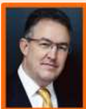
Burgemeester A. Aboutaleb, Voorzitter Coördinerend bestuurder

Zes leden uit het Algemeen Bestuur vormen het Dagelijks Bestuur. Het Dagelijks Bestuur is belast met de voorbereiding en uitvoering van de besluiten die het Algemeen Bestuur neemt. Ieder lid van het Dagelijks Bestuur heeft zijn / haar eigen portefeuille. Hieronder is een overzicht van het Dagelijks Bestuur opgenomen.