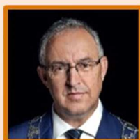
Burgemeester A. Aboutaleb, Voorzitter Coördinerend bestuurder

Zes leden uit het Algemeen Bestuur vormen het Dagelijks Bestuur. Het Dagelijks Bestuur is belast met de voorbereiding en uitvoering van de besluiten die het Algemeen Bestuur neemt. Ieder lid van het Dagelijks Bestuur heeft zijn / haar eigen portefeuille. Hieronder is de samenstelling van het Dagelijks Bestuur in 2022 opgenomen.