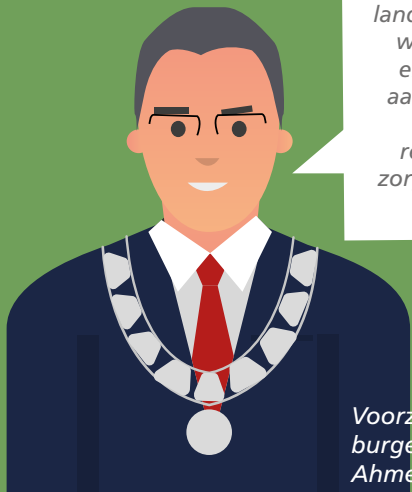
Voorzitter VRR en burgemeester Rotterdam Ahmed Aboutaleb

Rotterdam-Rijnmond heeft het hoogste risicoprofiel van Nederland: 15 gemeenten waar wonen, werken en recreëren dicht bij elkaar plaatsvindt. Effectieve aandacht voor veiligheid is een noodzaak. Samen met de regiogemeenten en partners zorgt de VRR voor die veiligheid.