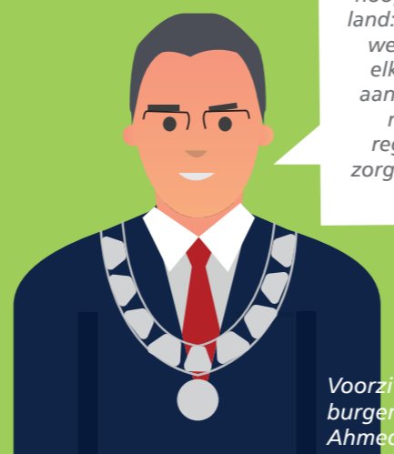
Voorzitter VRR en burgemeester Rotterdam Ahmed Aboutaleb

Rotterdam-Rijnmond heeft het hoogste risicoprofiel van Nederland: 15 gemeenten waar wonen, werken en recreëren dicht bij elkaar plaatsvindt. Effectieve aandacht voor veiligheid is een noodzaak. Samen met de regiogemeenten en partners zorgt de VRR voor die veiligheid.