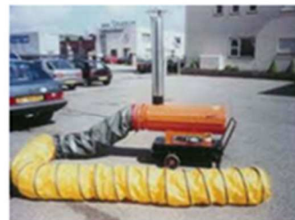
hete lucht kanon