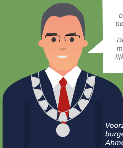
Voorzitter VRR en burgemeester Rotterdam Ahmed Aboutaleb

'De Veiligheidsregio Rotterdam-Rijnmond weet een complexe opgave goed uit te voeren en weet te anticiperen op maatschappelijke ontwikkelingen. De VRR is vooruitstrevend als crisisorganisatie voor veiligheidsvraagstukken en kan bogen op goede prestaties en een groot lerend vermogen.'