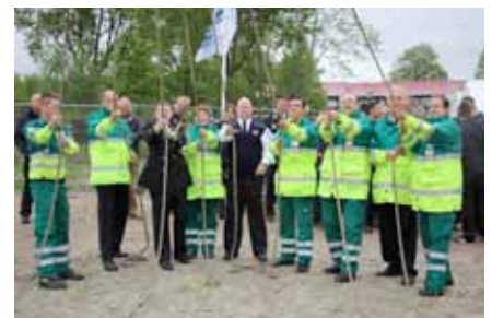
Woensdag 29 mei 2013 werd de eerste paal geslagen van de VRR kazerne in Goedereede.

Brandweerlieden mogen maximaal 20 jaar in een bezwarende repressieve functie werken, daarna moeten ze de overstap maken naar een niet-bezwarende (tweede) loopbaan. In 2013 legde het P&O-mobiliteitsteam de basis voor het tweede loopbaanbeleid binnen